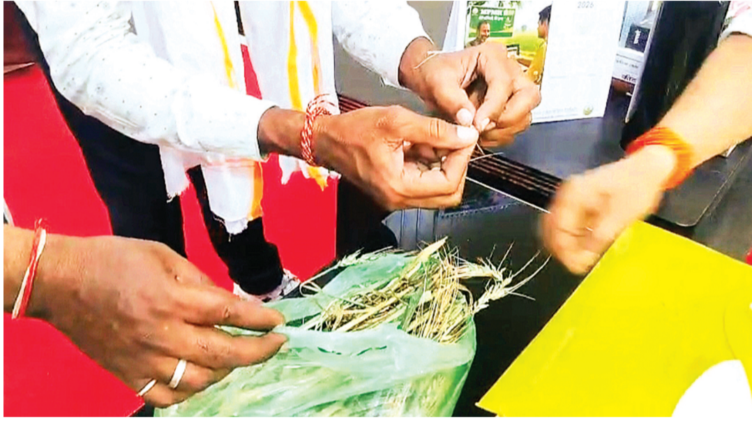
नौसम की मार, बढ़ती लागत और अब अमानक बीज पर किसानों ने उठाया बड़ा सवाल

किसानों का कहना है कि खेती पहले ही मौसम की मार और बढ़ती हुई लागत से जूझ रही है। ऐसे में यदि महंगे दामों पर खरीदा गया बीज भी अपेक्षित परिणाम न दे तो किसान आखिर जाए तो जाए कहीं। किसानों ने सवाल उठाया है कि अगर महंगा बीज भी इस तरह अमानक प्रदर्शन करेगा तो किसान किस पर भरोसा करे और बीज आखिर किससे ले? इस नुकसान की जिम्मेदारी कौन लेगा? किसानों का कहना है कि इस पूरे मामले की निष्पक्ष जांच करके ही सच्चाई को सामने लाया जा सकता है।